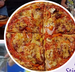
Unser Gemeindefest profitierte vom schönen Wetter, der guten Stimmung und den Angeboten für alle Generationen.

Herzlichen Dank allen, die geholfen und gespendet (Torten, Kuchen, Bücher...) haben!