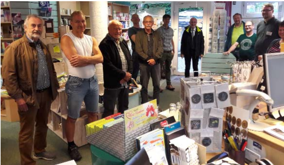
Die Männerarbeit Laineck, die sich einmal im Monat trifft, folgte im Juni einer Einladung der Buchhandlung Christothek. Nach einer kurzen Einführung und Vorstellung des Teams machten die zehn Männer erstmal Brotzeit und ließen sich verwöhnen. Danach wurde kräftig geschmökert. Übrigens waren wir der erste Männerkreis in der Christothek, vorher haben sich nur Frauenkreise einladen lassen.