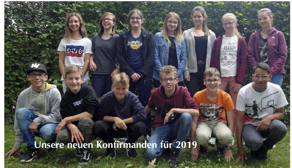
Unsere neuen Konfirmanden für 2019